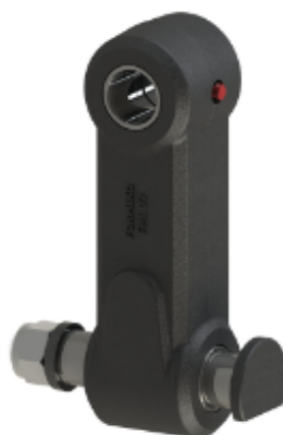
ПОДВЕСКА FHL 03 ГАБАРИТНЫЙ ЧЕРТЁЖ